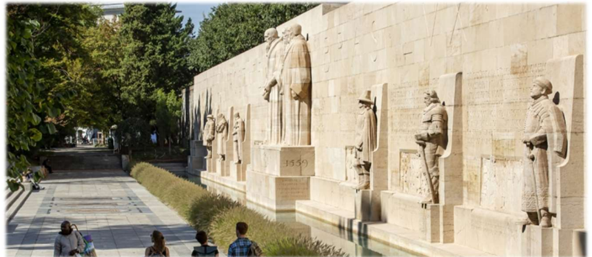
Mur des Réformateurs (saurez-vous les reconnaître... ?)

Nous envisageons de réserver pour le voyage un car qui pourra accueillir 50 personnes. Nous prévoyons un hébergement du côté français, à la frontière, pour limiter les frais. Mais, bien sûr, ce voyage aura un coût certain que nous ne sommes pas en mesure encore de vous indiquer ; car ce voyage est prévu du jeudi 8 au dimanche 11 mai 2025 (congés de l'Ascension) !