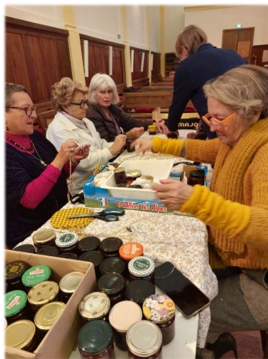
Les préparatifs du synode !