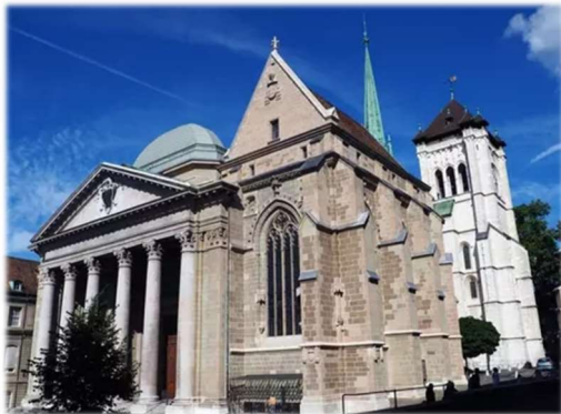
Cathédrale de Genève