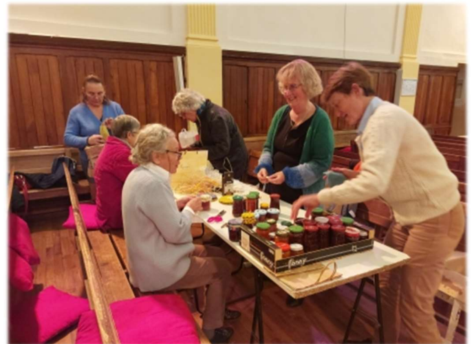
On se prépare !